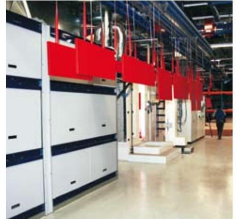
Nach dem Ofen kühlen die beschichteten Teile aus, werden abgehängt und verpackt.

Klebrige Kinderhände oder Wasserspritzer im Bad. Der Alltag geht an unseren feinstrukturierten Oberflächen spurlos vorbei – so robust und widerstandsfähig sind sie. Und sollte doch mal was haften bleiben, wischen Sie den Schmutz mit einem feuchten Lappen einfach weg.